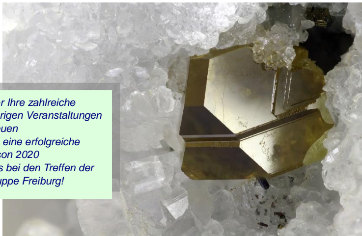
Sphalerit , Grube Lengenbach /Binn, BB 4,6 mm

Wir würden uns über Ihre zahlreiche Teilnahme an den diesjährigen Veranstaltungen sehr freuen und wünschen Ihnen eine erfolgreiche Sammelsaison 2020 sowie viel Interessantes bei den Treffen der VFMF Bezirksgruppe Freiburg!