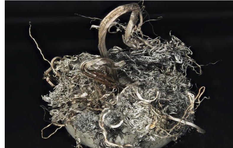
Silber, Grube Anton, Wieden, BB: 2,5 cm